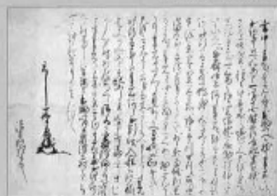
上杉景勝書状(複製)