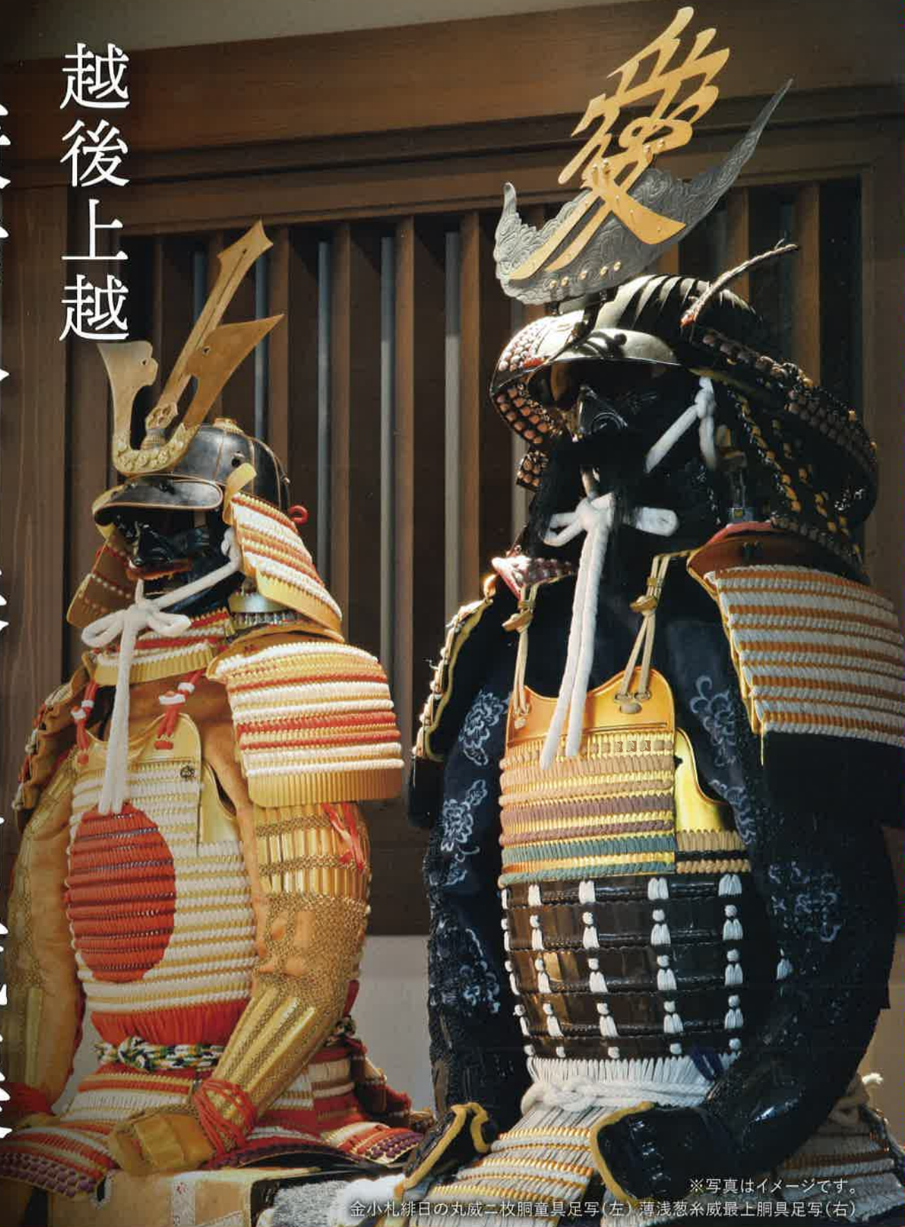
※写真はイメージです。 金小札緋日の丸威二枚胴童具足写(左) 薄浅葱系威最上胴具足写(右)