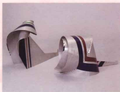
渡邊利旭(毛繕いする猫)