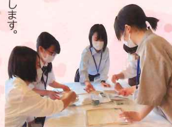
高校生キュレーター活動の様子