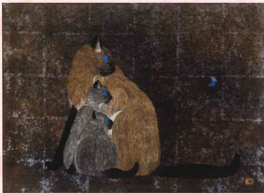
加山又造(ヘルシヤ猫)Jマテ.ホールディングス株式会社寄託

本展では「高校生キュレーター」として半年間展覧会の企画・準備に関わってきた高校生10人が、当館コレクションの中から作品をセレクトし、展示します。彼らの感覚で選んだかわいい作品について、見た人それぞれがどんな感情を持ってしまったか。絵画や彫刻、写真、工芸の幅広い分野にわたって、上越弁で言うところの「ばっかかわいい」美術を紹介します。