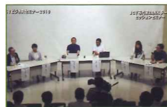
専門家BANKチームセッションセミナー