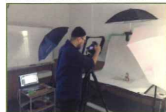
アドバイス相談会(商品撮影)