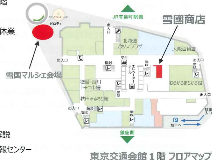
東京交通会館1階フロアマップ