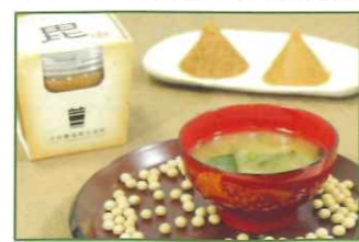
在宅試食アンケート 出品商品