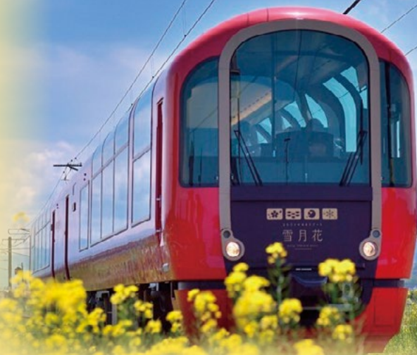
えちごトキめきリゾート雪月花