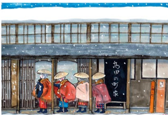
旧今井染物屋・高田瞽女の門付け再現 ひぐち キミヨ 作