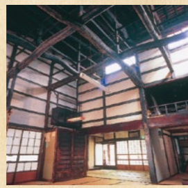
町家 旧今井染物屋 map 7 (上越市指定文化財)

「雁木(がんぎ)」は家の前に出した庇(ひさし)の呼び名です。豪雪地帯の高田において冬の生活道路を確保するため、居住者が私有地を提供し合い造られました。高田に現存する雁木の総延長は日本一です。「町家」と「雁木」は城下町高田を特徴づけるものとして市民と行政が協力し保存・活用に取り組んでいます。