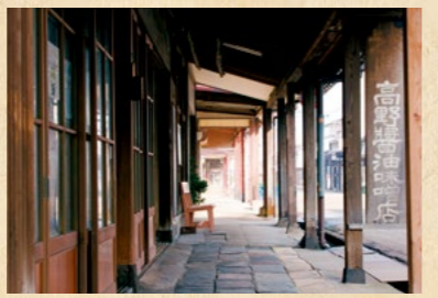
高田の雁木 map 8