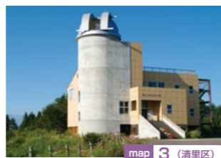
map 3 (清里区)