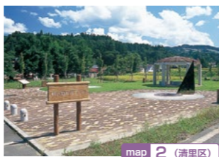
map 2 (清里区)