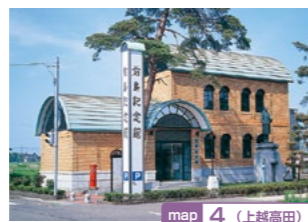
map 4 (上越高田)