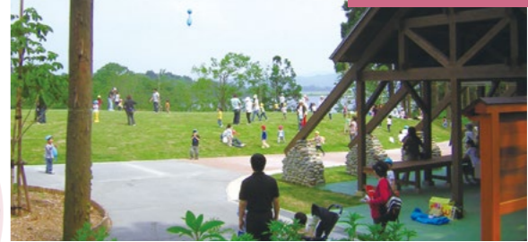
新潟県立大潟水と森公園 map 2 (大潟区)

水と森に囲まれ、雄大で美しい自然を有し、春にサクラ、夏にアジサイが迎えてくれます。公園には鶴の池と朝日池の大きな池が隣接し、マガモ、ミコアイサなど多くの水鳥が飛来します。