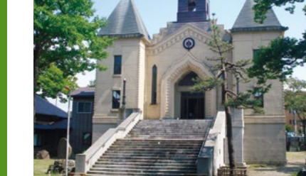
じょうぜんじ 浄善寺 国登録有形文化財 map 8 (柿崎区)

インドのパゴダ様式を取り入れたエキゾチックな寺院。親鸞聖人が枕にして身を横たえたという「御枕石」があることで知られています。