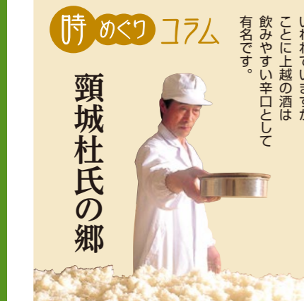
時めりコラム 頸城杜氏の郷

TEL 10:00~16:00 月曜日(祝日の場合は翌日)、年末年始 ※冬期休館有 一般310円、中学生以下無料 TEL 025-530-3100 北陸自動車道柿崎ICから車で20分