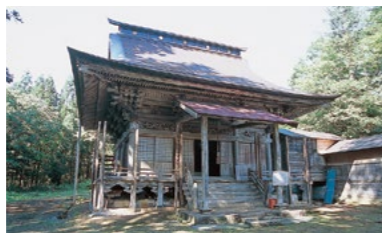
みつぞういん 密蔵院 map 6 (柿崎区)

TEL 025-536-5205 北陸自動車道柿崎ICから車で20分 柿崎バスターミナルからバス23分「芋の島中」下車徒歩2分