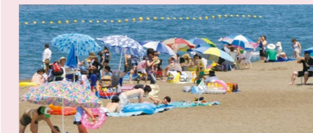
鶴の浜海水浴場 map 4 (大潟区)

鶴の浜海水浴場は、広い砂浜と水質Aランクのきれいな水が自慢の海水浴場です。温泉のあるリゾートビーチとして人気が高く、県内外から多くの海水浴客で賑わいます。晴れた日、日本海に沈む夕日を背景に見る人魚像はまさに絶景です。