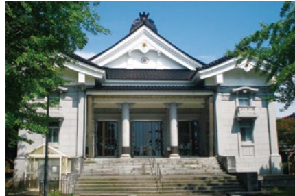
じょうふくじ 浄福寺 map 9 (柿崎区)

登山開き5月最終日曜日 TEL 025-536-2211 (柿崎区総合事務所) 北陸自動車道柿崎ICから下牧登山口(下牧ベース993)まで車で20分、水野林道終点まで車で30分