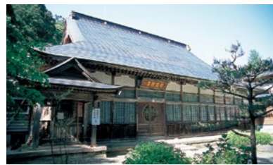
りょうこんじ 楞嚴寺 国登録有形文化財 map 7 (柿崎区)

天文3年(1534)に上杉四天王の一人、柿崎和泉守景家が建立した禅寺。景家は、ここに謙信公の師僧・天室光育を招き、柿崎の学問・文化を築きあげたといわれています。