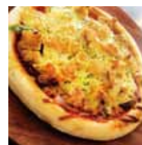
■ぶらんカフェ 「するてんビザ〜自家製煮込みトマトソース」※ ※印は2026年2月7日イベント限定メニューです