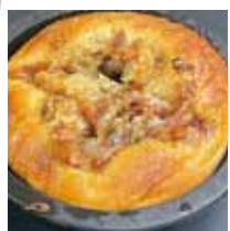
■小麦の奴隷 「スル・テン・パン」※