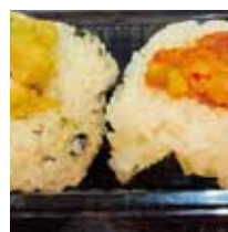
■大地のめくみ 「大人の辛み する天おむすび」