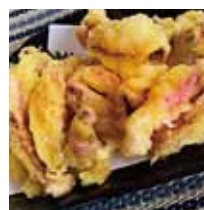
■西かつ 「するてん・カレー風味」※