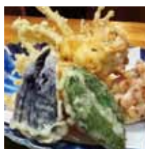
■肴や活等 「一沙スルメと野菜の爆弾揚げ」