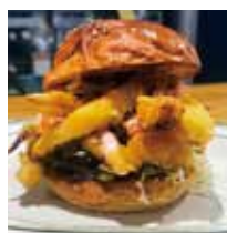
■バーガーカフェ&グリル PICCOLO 「する天バーガー」※