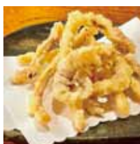
■すりみ屋 「郷土の味 するてん」※