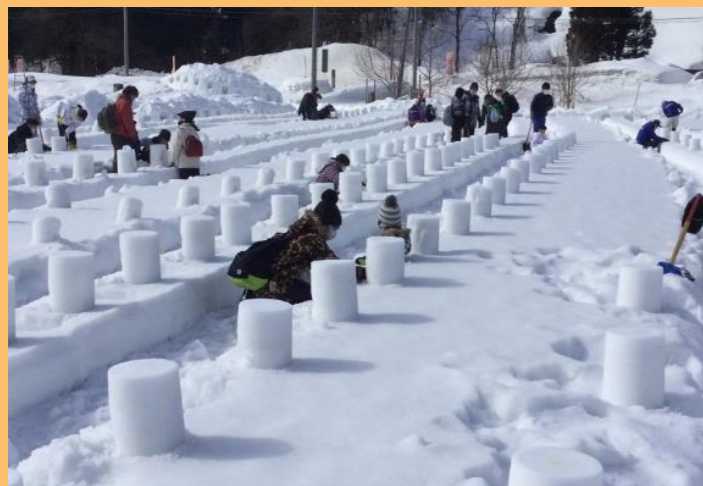
みんなで仲良く制作しています^^