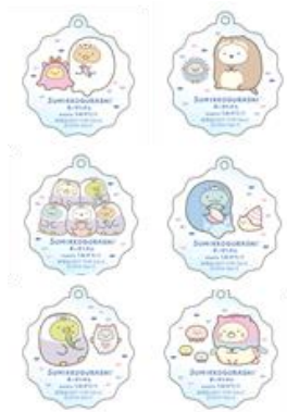
アクリルキーホルダー