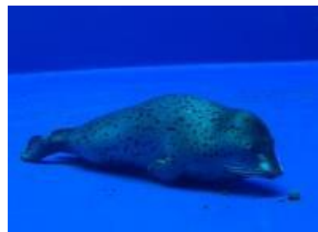
イルカやアザラシの眠り方の違いを観察