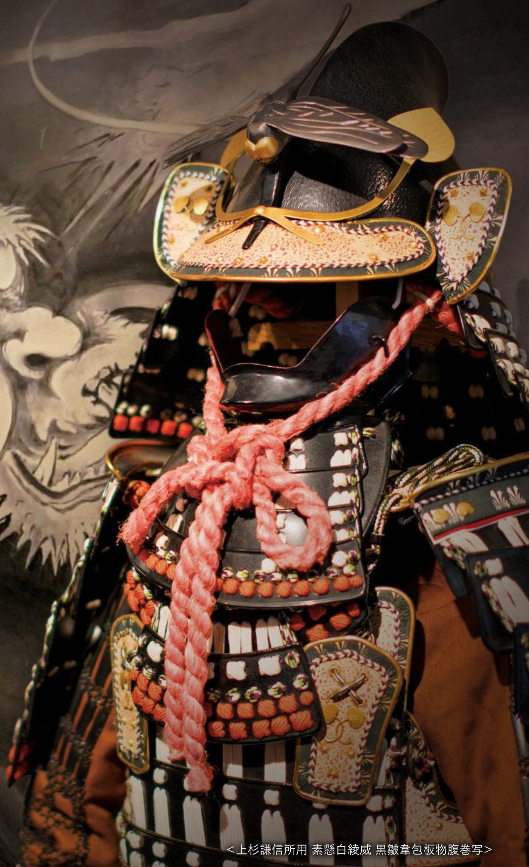
<上杉謙信所用 素懸白綾威 黒皴韋包板物腹巻写>