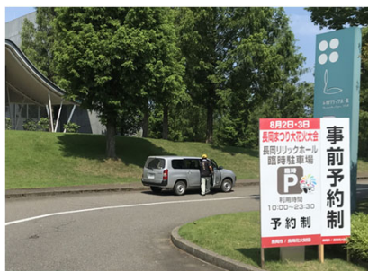
長岡花火 公式駐車場