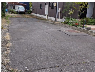
柏崎花火 徒歩15分 5,000円/1台