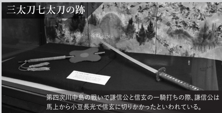
三太刀七太刀の跡

第四次川中島の戦いで謙信公と信玄の一騎打ちの際、謙信公は 馬上から小豆長光で信玄に切りかかったといわれている。