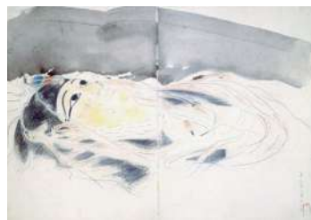
《エジプトミイラ女人》(1923年)

古径さんはエジプトへ 行ったことがあるよ。 ミイラは博物館で見て 描いたものなんだ！