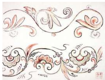
《三墓里第一古墳唐草文様》