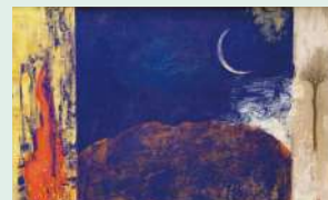
柴田長俊《野火》「久比岐野十二景」より(2005年)小林古径記念美術館蔵

2022年1月に72歳で亡くなった上越市出身の日本画家・柴田長俊の作品を所蔵品を中心に紹介します。