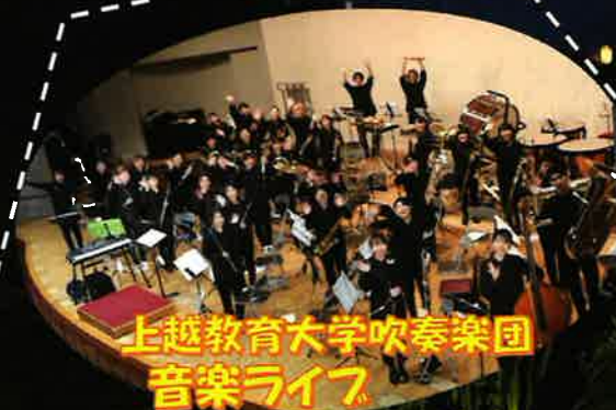
上越教育大学吹奏楽団 音楽ライブ