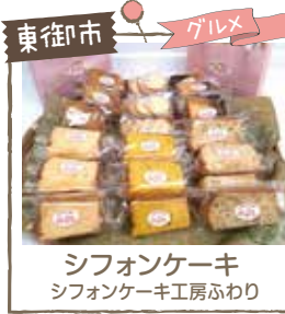
東御市 グルメ シフォンケーキ シフォンケーキ工房ふわり