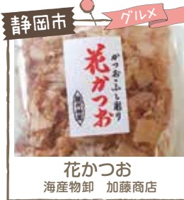
静岡市 グルメ 花かつお 海産物卸 加藤商店