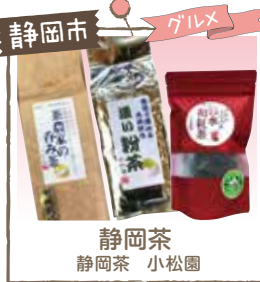
静岡市 グルメ 静岡茶 静岡茶 小松園