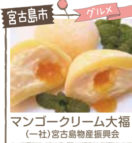
宮古島市 グルメ マンゴークリーム大福 (一社)宮古島物産振興会