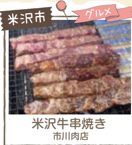
米沢市 グルメ 米沢牛串焼き 市川肉店