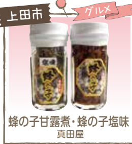
上田市 グルメ 蜂の子甘露煮・蜂の子塩味 真田屋