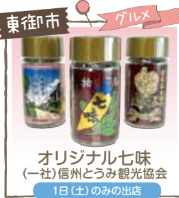
東御市 グルメ オリジナル七味 (一社)信州とうもろこし観光協会 1日(土)のみの出店