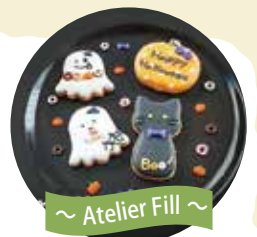
~ Atelier Fill ~

ハロウィンにぴったりな猫・かぼちゃ・オバケのアイシングクッキーをデコレーションできます。お友達・ご家族でシェアして参加もOKです!