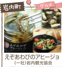
岩内町 グルメ えぞあわびのアヒージョ (一社)岩内観光協会