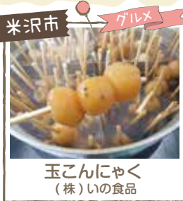
米沢市 グルメ 玉こんにやく (株)いの食品