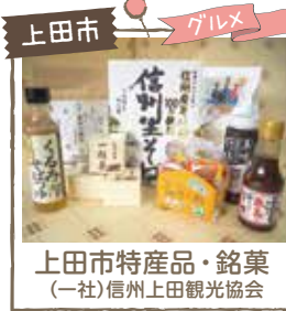
上田市 グルメ 上田市特産品・銘菓 (一社)信州上田観光協会