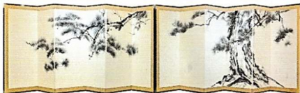
「松壽千草」(自作) (六画一双屏風)

特別企画 春艸先生と作る 水墨画コースター 9/3(土)・23(金) 両日とも13:30～15:30の間 ※製作時間は15分ほどかかります。 作品展開館中の春艸先生指導のもと、自然豊かな大池のほとりであつたひと時をお楽しみ下さい。 参加費：500円 入館料別途 ※先着順となりますのでお早めにご予約下さい。