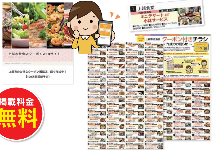
※昨年イメージです

新型コロナウイルス感染症の拡大により落ち込んだ消費を取り戻し、飲食店舗への誘客を促すため、上越市内の飲食店の情報と、店舗で利用できるクーポンを掲載した専用WEBサイトとチラシを作成します。店舗のPRと、集客アップが期待できる限定企画となりますので、是非お申込みください。