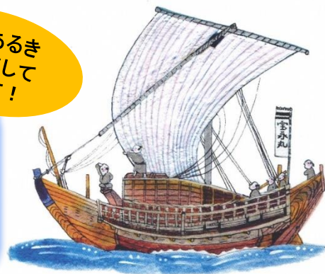
イラスト: ひぐちきみよ

【まちあるき申込先】上越市 教育委員会 文化行政課 TEL: 025-545-9269 FAX: 025-545-9272