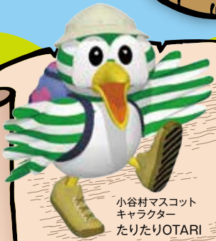
小谷村マスコットキャラクター たりたりOTARI