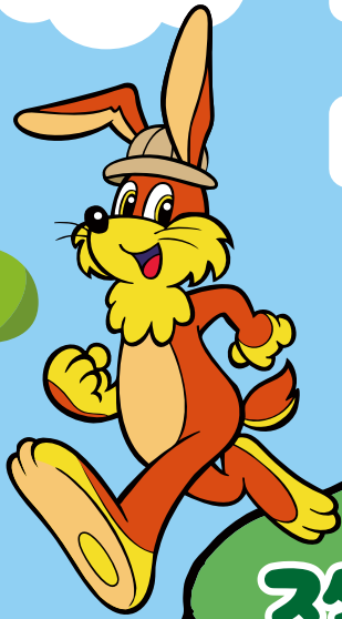
北越急行マスコットキャラクター ホックン