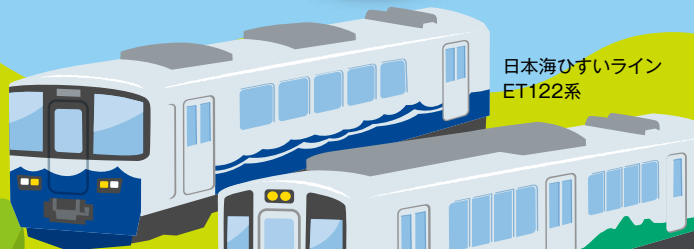
日本海ひすいライン ET122系