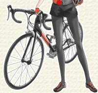
くびきりん 「久比岐 凧」 久比岐自転車道PRキャラクター