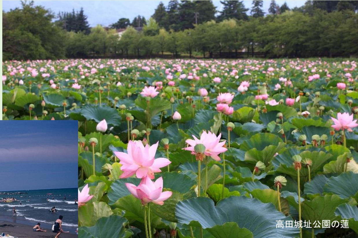
高田城址公園の蓮