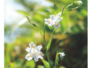
うす紫色の花が初夏を告げるシャガ