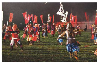
川中島合戦の再現