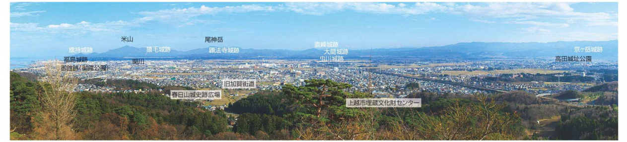
春日山城跡本丸からの眺望

【春日山城の支城・砦跡(一部)】 旗持城(柏崎市)・柿崎城跡(柿崎区)・猿毛城(柿崎区)・顕法寺城(吉川区) 雁金城(頸城区)・城山狼煙場(大高区)・虫川城(浦川原区)・直峰城(安塚区)・大間城(三和区) 池舟城(牧区)・北方城(高土地区北方)・白看板城(清里区)・京ヶ岳城(清里区)・焼山城(板倉区) 箕冠城(板倉区)・黒田城(金谷地区黒田)・トヤ峰砦(金谷地区下正善寺)・宇津尾砦(金谷地区宇津尾) 城ヶ峰砦(谷浜)・桑取地区中桑取)・日の入城(名立区)・鳥坂城(妙高市)・鯉ヶ尾城(妙高市)