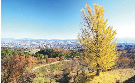
二の丸の一本イチョウ

春日山巡りコース ※上越市観光ガイド(有料)をご希望の方は、希望日の2週間前までに(公社)上越観光コンベンション協会へお申込み下さい。(TEL025-543-2777)。