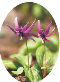
可憐な花を咲かせるカタクリ

御城印 令和 年 月 日 価格：300円 来城の記念となる御城印を頒布しています。詳しくは、市ホームページ(文化行政課)をご覧ください。上越市教育委員会文化行政課までお問合せ下さい。(TEL:025-545-9269) ※来城の記念にしていたがたいことから、郵送での頒布は行っていません。