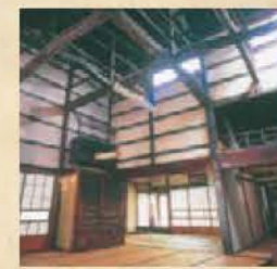
町家 旧今井染物屋 map 2

「町家」は、限られた土地に多くの人が住むために工夫された間口が奥行き長い家造りで、戸を開けて家に入ると、「みせの間」「茶の間」「座敷」の順に配置され、その横に長い通り庭が建物の表から裏まで通り、茶の間の上部には明かり窓をもった美しい吹き抜け空間が広がります。「雁木(がんぎ)」は家の前に出た庇(ひさし)の呼び名です。豪雪地帯の高田において冬の生活道路を確保するため、居住者が私有地を提供し合い造られました。高田に現存する雁木の総延長は16kmにも及び、日本一です。「町家」と「雁木」は城下町高田を特徴づけるものとして市民と行政が協力し保存・活用に取り組んでいます。