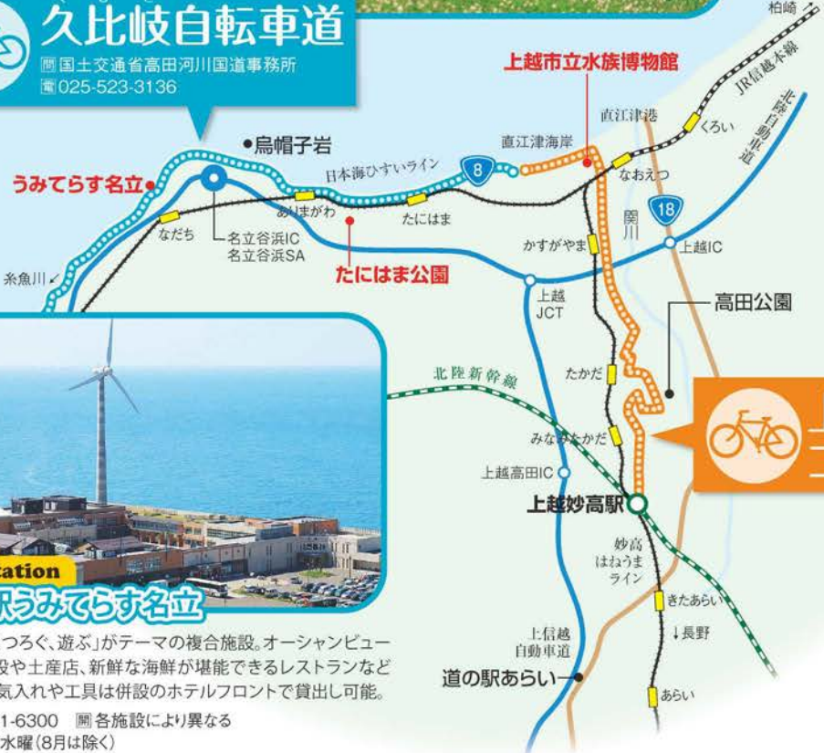
🚲 上越サイクリングコース

くびき 久比岐自転車道 国土交通省高田河川国道事務所 電話: 025-523-3136