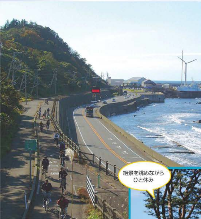
絶景を眺めながらひと休み

上越妙高駅から直江津海岸を結ぶのは「上越サイクリングコース」。コース沿いには、桜や蓮が美しい高田公園や上越市立水族博物館もあり、立ち寄る楽しみもある。市街地を抜けて目の前に日本海が現れる瞬間は格別だ。