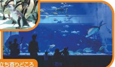
立ち寄りどころ 上越市立水族博物館

日本一の飼育数を誇るマゼランペンギンをはじめ、約400種10,000点の生物を飼育・展示。大迫力の大回遊水槽マリンジャンボや、愛らしいコツメカワウソなど見どころいっぱい。 開館時間: 9:00~17:00 (GW期間は18:00まで) 休館日: 月曜(祝日の場合は開館) 料金: 大人900円、小中学生400円、幼児200円 電話: 025-543-2449 ※新水族博物館建設工事にともない、平成29年5月15日(月)より長期休館となります。