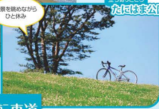
立ち寄りどころ たにはま公園