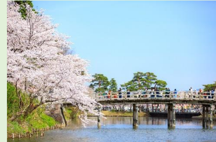
高田城百万人観桜会