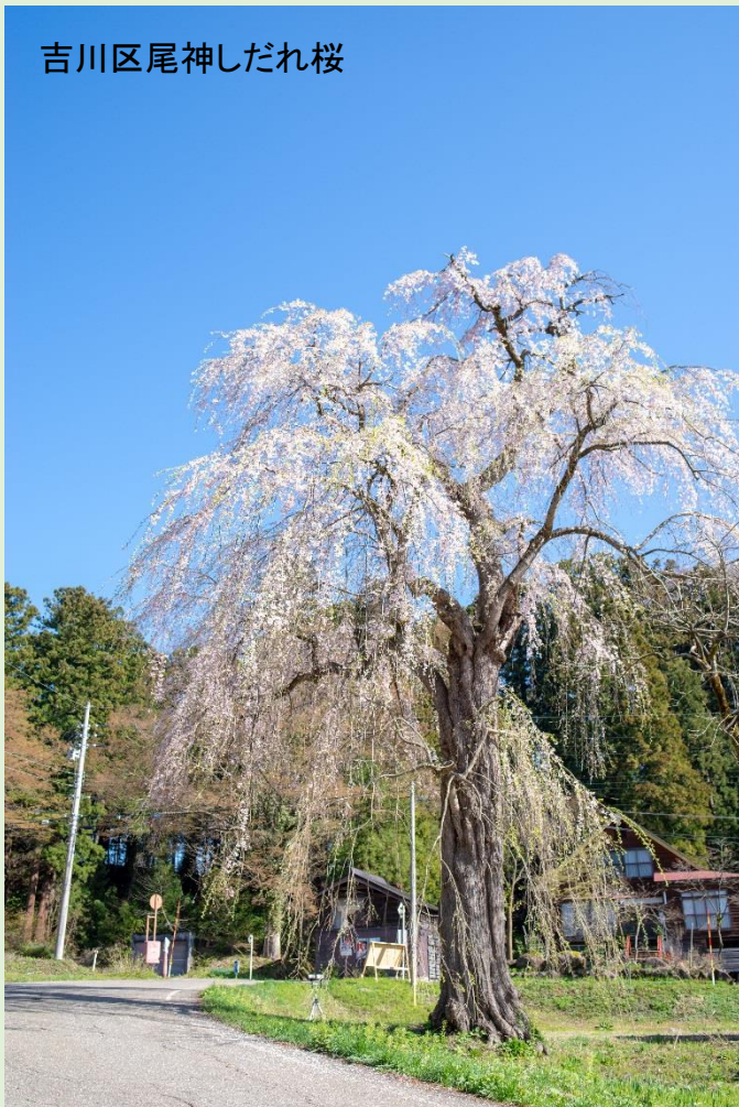
吉川区尾神しだれ桜