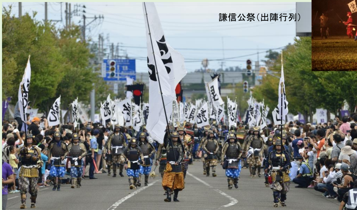
謙信公祭(出陣行列)