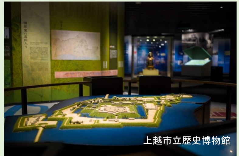
上越市立歴史博物館

2018年6月に上越市立水族博物館「うみがたり」がグランドオープンしました。 また、同年7月に上越市立歴史博物館がリニューアルオープンし、 市内に新たな魅力が増えました。