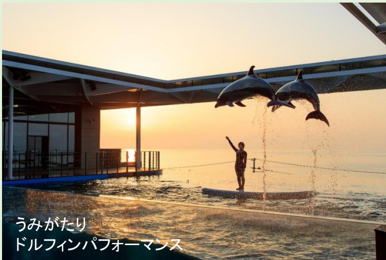
うみがたり ドルフィンパフォーマンス