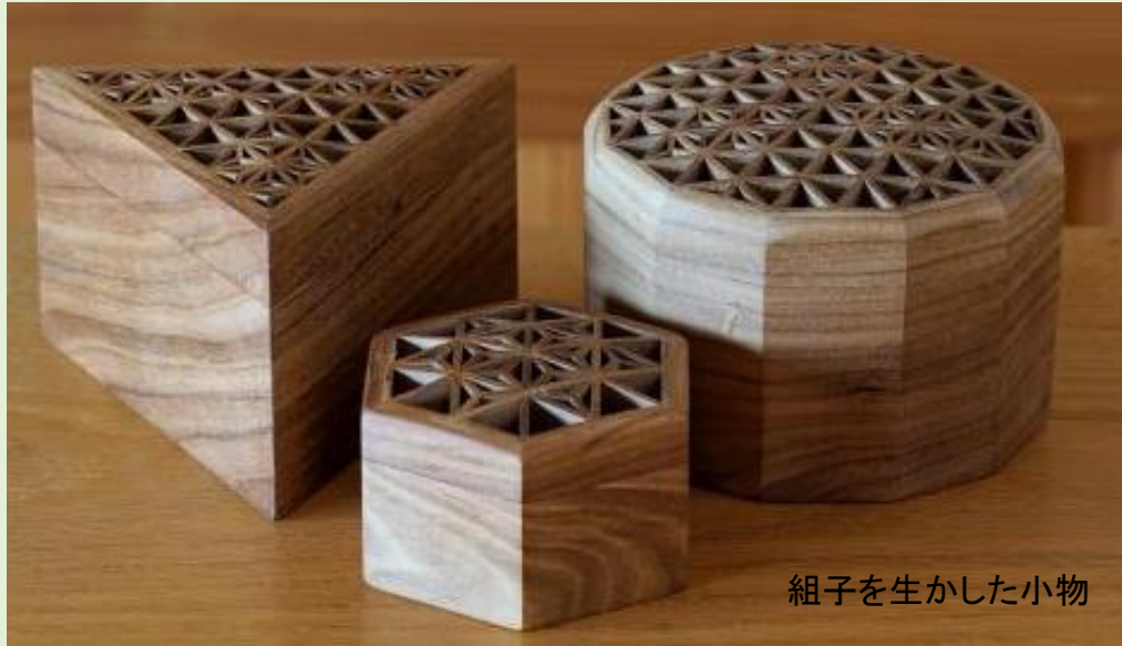
組子を生かした小物