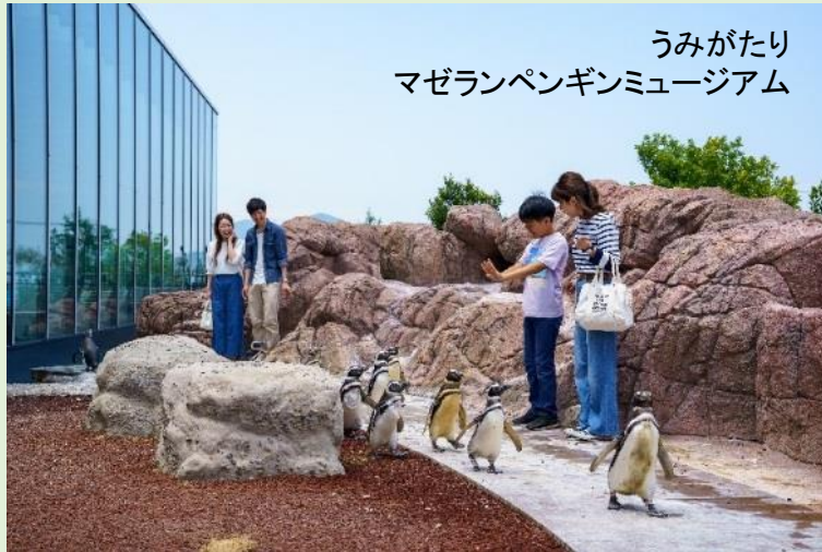
うみがたり マゼランペンギンミュージアム