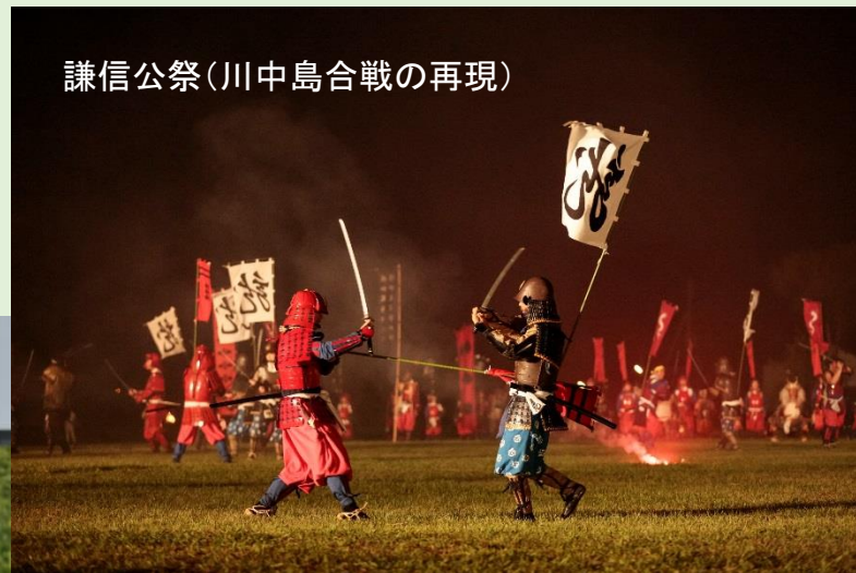
謙信公祭(川中島合戦の再現)